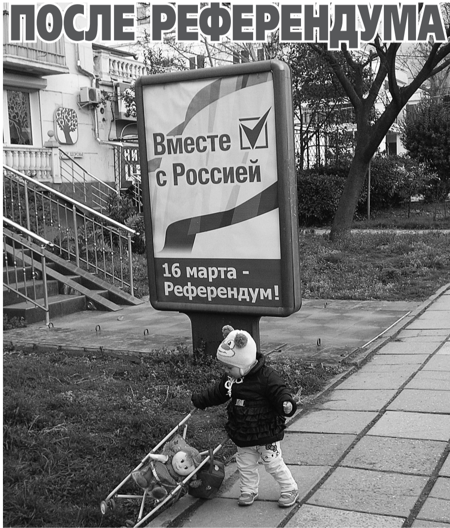
Пусть эта юная ялтинка со своими внуками и правнуками отметит 100-летие референдума!

А если подобная точка зрения возобладает в американском истеблишменте (особенно после одновременного «слива» 13 марта американских гособлигаций на сумму более 100 млрд. долл., в чем подозревают «частных» китайских инвесторов), лидерам «майданной Украины» не светит ничего хорошего.