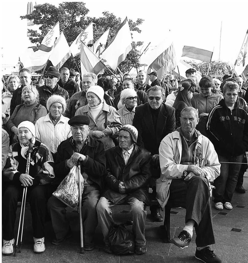
Ялтинские пенсионеры и дети войны были самыми активными в день голосования

Референдум в Крыму состоялся, 96,77% голосовавших высказались за Россию и против необандеровцев. В Киеве и на Западе объявили и итоги референдума, и само его проведение «нелегитимными», угрожают самыми жесткими и обширными санкциями за «нарушение территориальной целостности суверенного государства». Ближайшие дни могут стать решающими для судеб не только Украины и России, но всего мира.